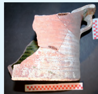
Bacín siglos XVII-XVIII