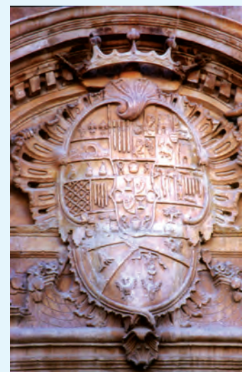
Escudo nobiliario en la Iglesia de Santiago