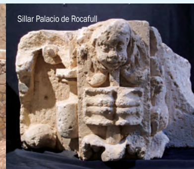
Sillar Palacio de Rocafull

rica agricultura de Albaterra se ha caracterizado siempre por excelentes productos: las brevas y las granadas. Ambos cultivos, de una calidad inigualable, representan al municipio en las mejores cocinas y fogones, siendo una huella identitaria fundamental en la actualidad.