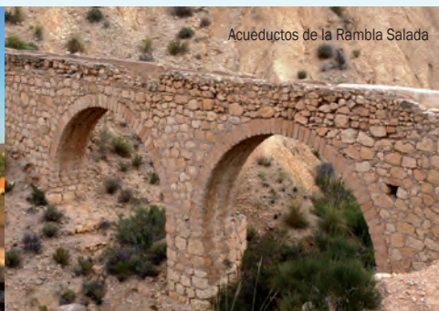
Acueductos de la Rambla Salada