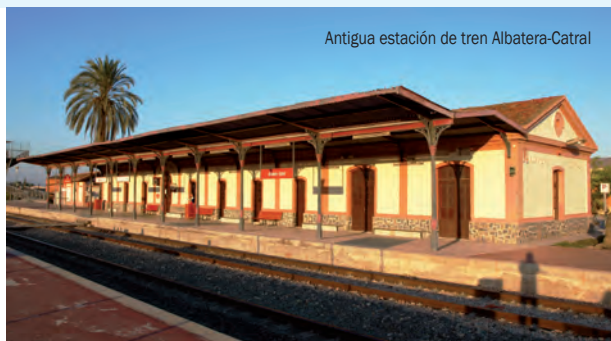
Antigua estación de tren Albaterra-Catral