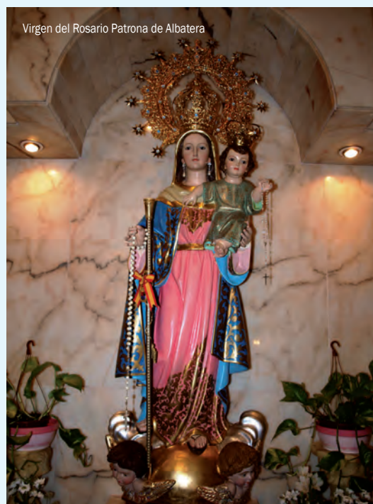
Virgen del Rosario Patrona de Albaterra