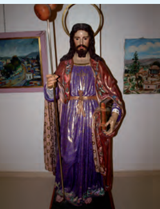
Santiago Apóstol, patrón de Albaterra, realizado por Valentín García