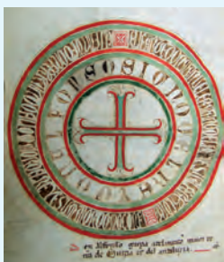
Privilegio Alfonso X

Albaterra, municipio de la Vega Baja del Segura, se encuentra ubicada en una posición privilegiada que le ha dado un valor estratégico a lo largo de la historia, y que hoy día sigue siendo un factor decisivo, por ejemplo, en la instalación de grandes empresas de logística.