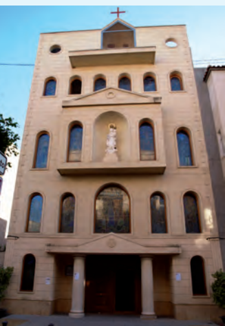
Ermita de la Virgen del Rosario

(Licenciado en Historia y técnico en gestión del Patrimonio Cultural)