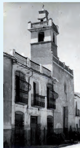
Ermita de la Aurora